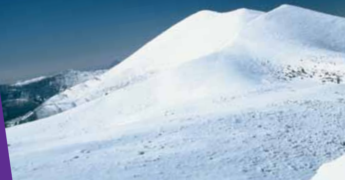
Cime du Pico de Guara en hiver (2077m). Summit of the Guara Peak in winter

We work to offer the maximum quality and a service which will make your stay be a real dream and will make you want to discover infinite secrets or just experience its magic in other season.