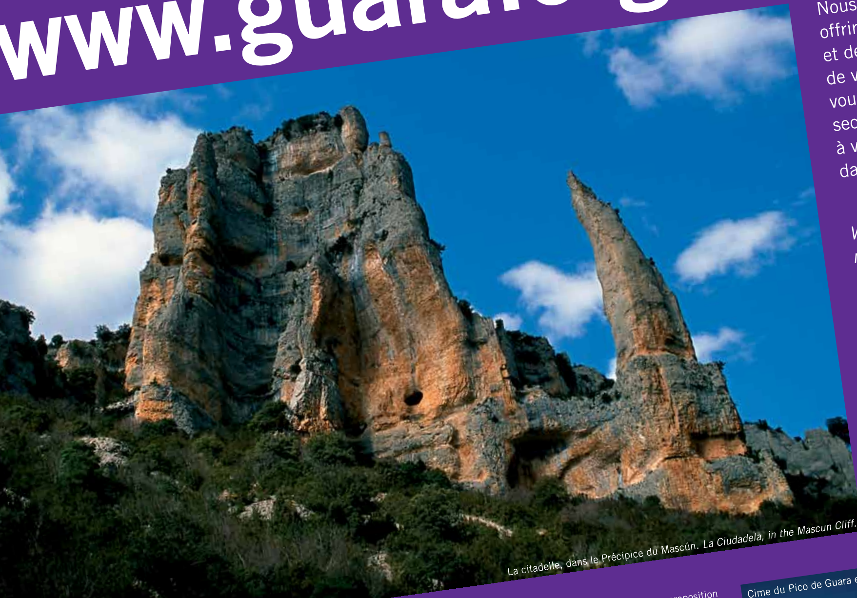
La citadelle, dans le Précipice du Mascún. La Ciudadela, in the Mascun Cliff.

Chaque époque de l'année a son charme. Chaque versant son climat. Pour chaque goût une proposition différente de séjour et de loisir. Pour chaque sens un plaisir. Un lieu parfait pour jouir en couple, en famille, en groupe d'amis ou avec l'entreprise. De l'association nous travaillons pour vous offrir le maximum de qualité et de service, pour faire de votre séjour un rêve qui vous invitera à découvrir les secrets infinis ou simplement à vivre son enchantement dans une autre saison.